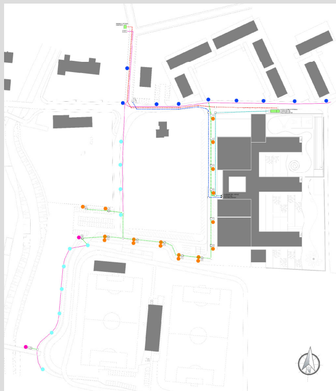
DISTRIBUZIONE ESTERNA IMPIANTI ELETTRICI